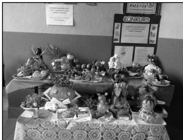
Nauczycielki z Przedszkola Publicznego w Świątoszówce

Wszystkim dzieciom i ich rodzicom bardzo dziękujemy za zaangażowanie, ogromną twórczość, pomysłowość i poświęcony czas oraz tak liczny udział w konkursie.