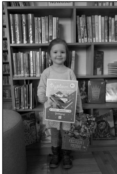
Ninka - „Mała książka - wielki człowiek”