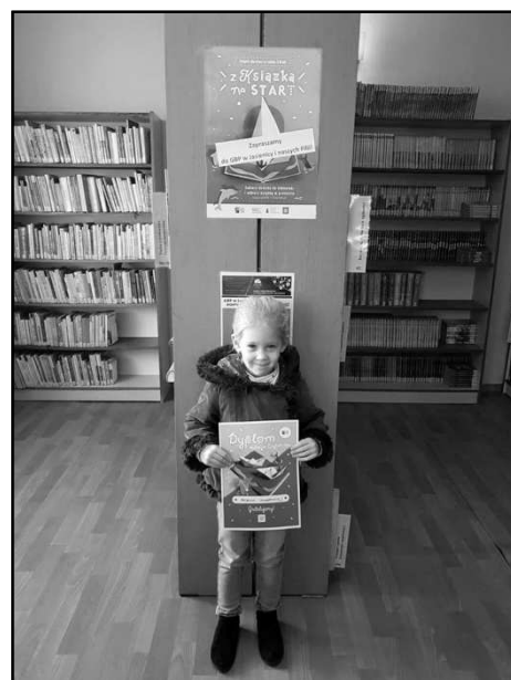
Majeczka - „Mała książka - wielki człowiek”