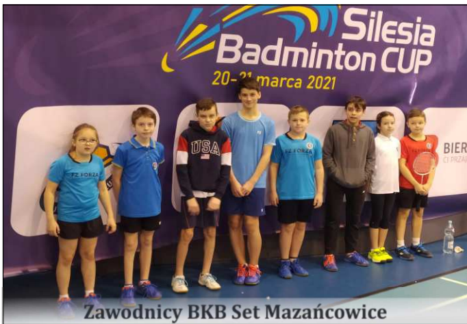
Zawodnicy BKB Set Mazańcowice