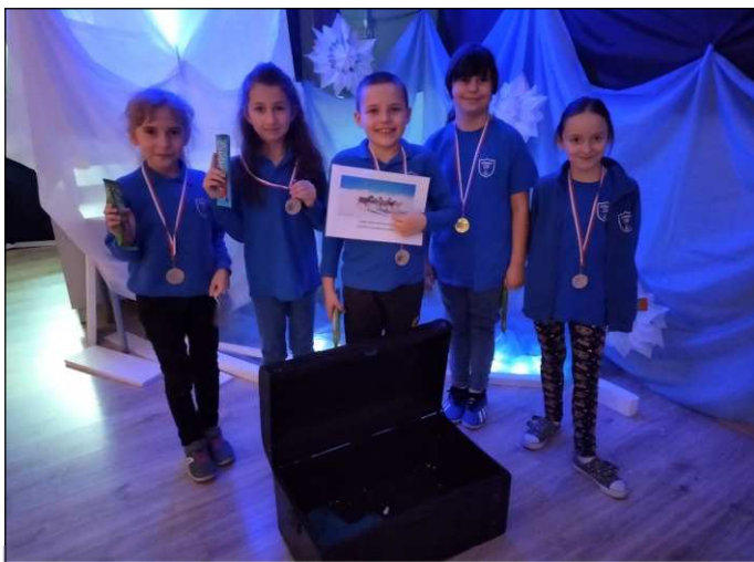
„MISJA ANTARKTYDA” – POKÓJ ZAGADEK W ZSP W IŁOWNICY 6