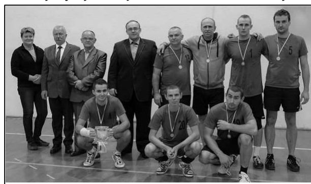
Zespół RUDZICA I

21.11.2015r. w transgranicznym turnieju siatkówki zorganizowanym przez Radę Gminy Chybie zdobywając pierwsze miejsce.