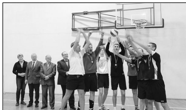
Zwycięzcy turnieju siatkówki Czecho-Volley

Dodam jeszcze, że nasz zespół siatkarski wziął udział