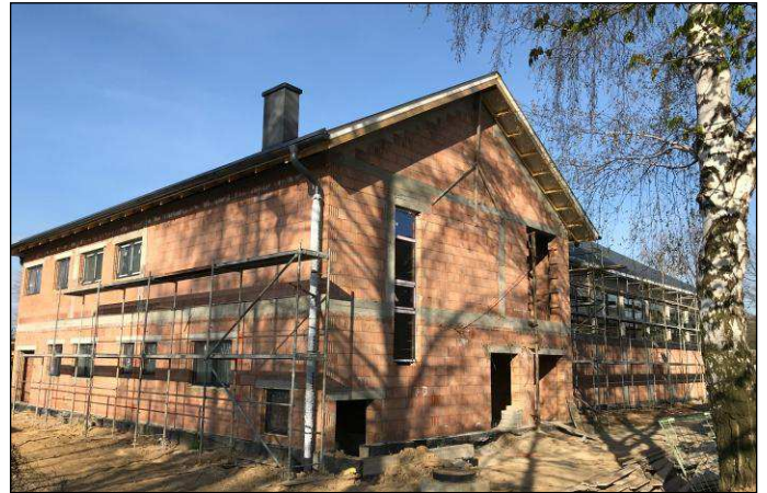
Trwa budowa nowej, dużej sali gimnastycznej przy szkole w Międzyrzeczu Górnym