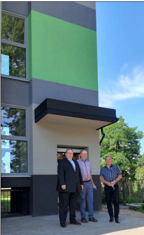
W Ośrodku Zdrowia w Rudzicy uruchomiono windę