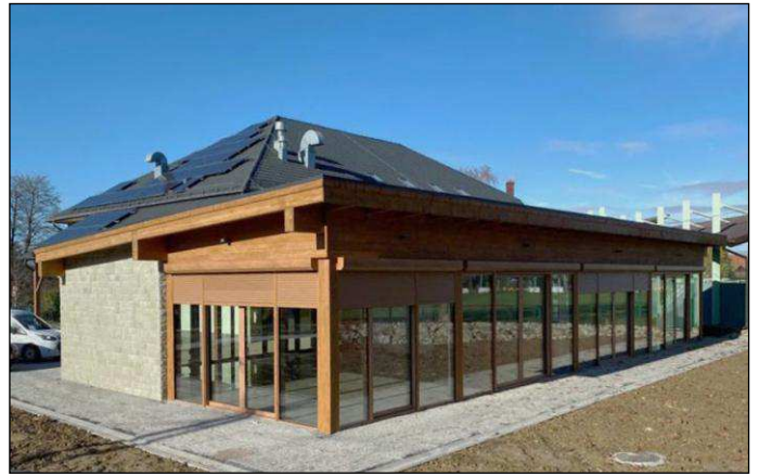
Zakończono budowę Centrum Edukacji "Ogród Tradycji"