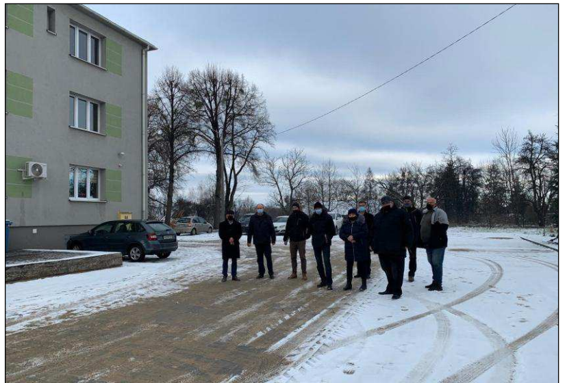
Zakończyła się budowa parkingu przy ośrodku zdrowia w Rudzicy