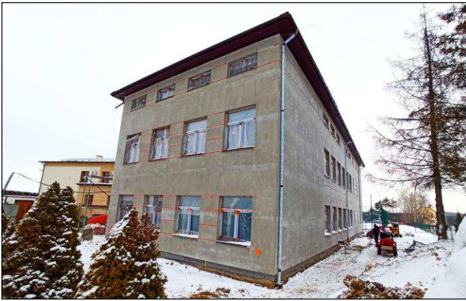
Rozpoczęła się rozbudowa szkoły w Świętoszówce