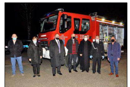
Nowe wozy strażackie dla OSP Międzyrzecze Dolne i Mazańcowice