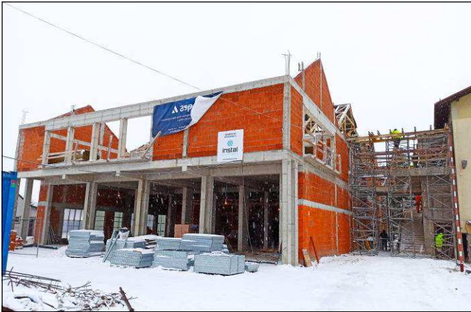
Ruszyła budowa strażnicy OSP oraz rozbudowa Urzędu Gminy w Jasienicy