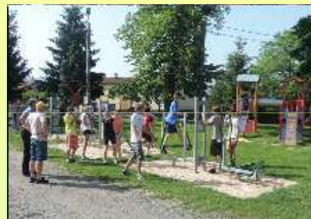
PLENEROWA SIŁOWNIA W RUDZICY