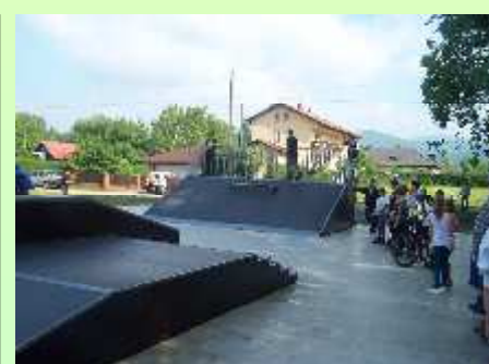
SKATEPARK W JASIENICY