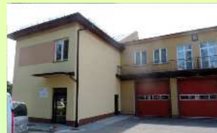
ŚWIETLICA W RUDZICY