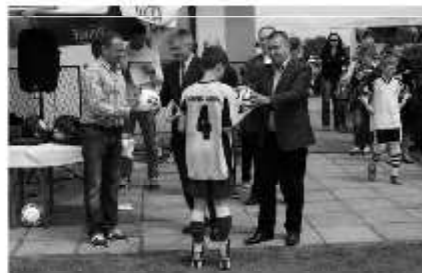
Sportowy Dzień Dziecka w Landeku