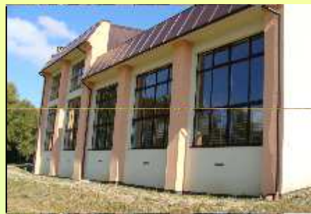
HALA W MAZAŃCOWICACH