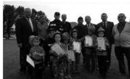
OSP - pomaga, ratuje i wychowuje