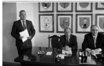
Aktywna współpraca z władzami gminy