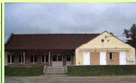
OBIEKT W MIĘDZYRZECZU D.