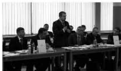
Dbalność o interesy Gminy Jasienica na forum Rady Powiatu

Finansowane ze środków KW Platforma Obywatelska RP