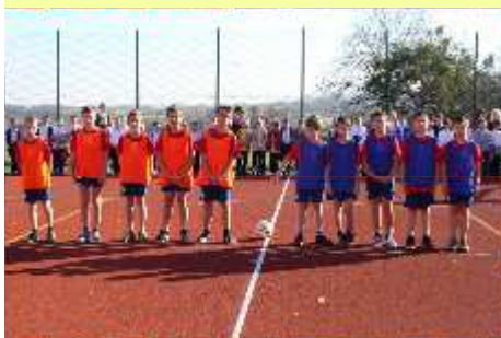
NOWE BOISKO W WIESZCZĘTACH