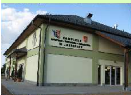
KOMPLEKS KULTURALNO-SPORTOWO- REKREACYJNY W JASIENICY