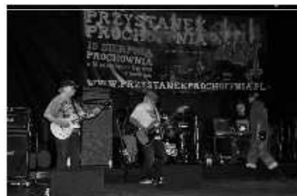
Przystanek ProchOFFnia: wspaniały koncert Dżemu