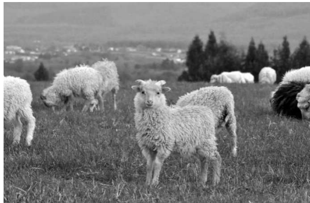
Uczestnik wyjazdu M. K.