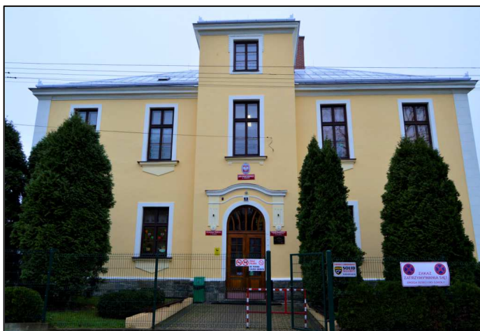
NAPRAWIONY DACH I ODNOWIONA ELEWACJA