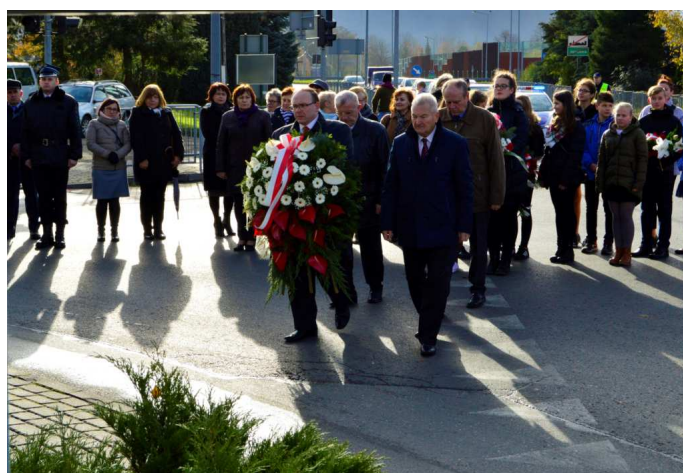
ZŁOŻYLI WIĄZANKI KWIATÓW