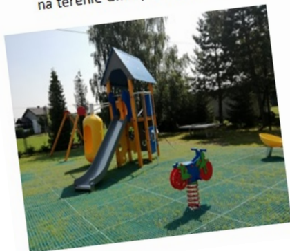
Gmina Jasienica projekt pn. "Budowa sieci placów zabaw z elementami siłowni zewnętrznej na terenie Gminy Jasienica – (sołectwa Międzyrzecze Górne, Jasienica, Itownica)"

Stowarzyszenie Lokalna Grupa Rybacka Bielska Kraina przez 5 lat wdrażania Lokalnej Strategii Rozwoju ogłosiło 16 naborów umożliwiających pozyskanie dofinansowania w ramach Programu Operacyjnego Rybactwo i Morze 2014-2020, m.in. przez jednostki samorządu terytorialnego, organizacje im podległe, rybaków, przedsiębiorców, osoby chcące założyć działalność gospodarczą. Za pośrednictwem organu decyzyjnego Stowarzyszenia, tj. Rady, wybrano do realizacji 14 projektów z obszaru Gminy Jasienica o łącznej wartości 2 031 212,00 zł . Projekty te pozwoliły rozwinąć region pod względem gospodarczym oraz zachować lokalne dziedzictwo kulturowo-historyczne i przyrodnicze obszaru. Poniżej przedstawiamy kilka przykładów dobrych praktyk wykorzystania środków unijnych z Programu Operacyjnego Rybactwo i Morze 2014-2020. Realizacja tych projektów podniosła walory kulturowe i przyrodnicze obszaru oraz dała lokalnej społeczności, a także osobom odwiedzającym Gminę, możliwość korzystania z ogólnodostępnej infrastruktury turystycznej i rekreacyjnej, m.in. z placów zabaw, siłowni zewnętrznych, zadaszonych wiat grillowych. Stowarzyszenie wsparło również gospodarstwa rybackie w zakresie modernizacji i innowacyjności, co przyczyniło się do rozwoju tych przedsiębiorstw, działalności w zakresie chowu i hodowli ryb słodkowodnych, poprawie jakości produktu oraz dostępności świeżej ryby przez cały rok, a nie tylko na święta.