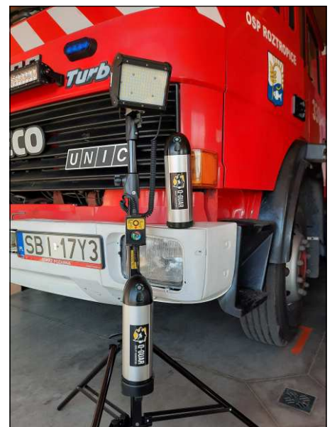
Nagroda - dodatkowy akumulator ek ufundowany przez firmę Q-Guar Innowacje, został już przekazany do OSP Roztropice.